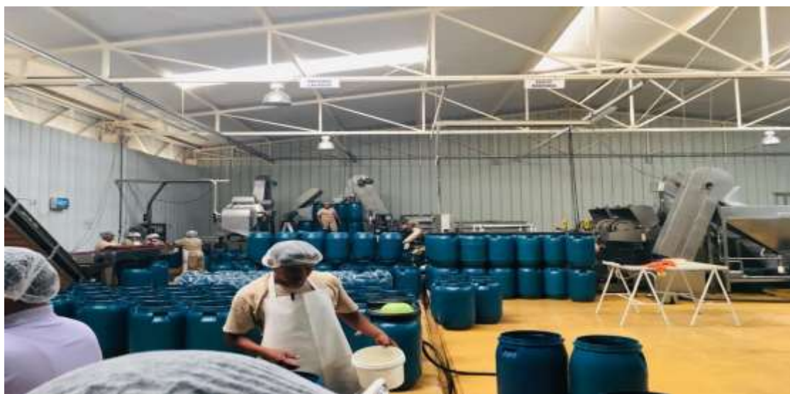
Figura 1 Planta de procesamiento de aceituna

Es una de las técnicas de recolección más usadas, la encuesta se fundamenta en un cuestionario o conjunto de preguntas que se preparan con el propósito de obtener información de las personas. (Hernández, Fernández, & Baptista, 2010). Las encuestas se realizaron a las principales empresas agro – exportadoras del Distrito de La Yarada – Los Palos, las encuestas serán respondidas por el área financiera-contable, donde estará a cargo el contador general de la empresa en